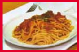
ピリ辛トマトパスタ(350円) ~レッズカラー仕立て~