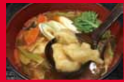
チゲすいとん(350円) ~福島の食材をたっぷりと~