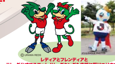
レディアとフレディアと Jリーグ公式マスコットJリーグキングも応援に駆けつけます!!